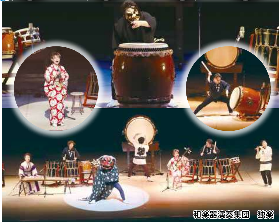
和楽器演奏集団 独楽