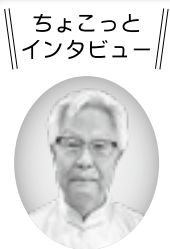
ちょこっとインタビュー

トップバッターは幕開けにふさわしく箕面南朗友会のフラダンスが登場。続いてカラオケや舞踊、太極拳、フォークダンス、ハーモニカ、民謡、盆踊りなど全32組の出演者が舞台を彩りました。